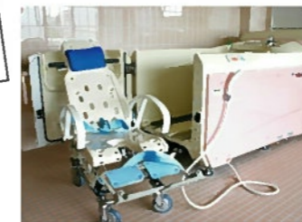
チェアインバスが設置された浴室