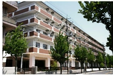
南西側から見た外観