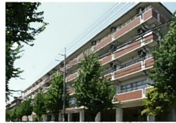
南東側から見た外観