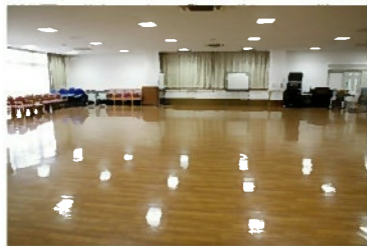
レクリエーションルーム