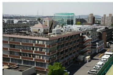
上層から見た施設