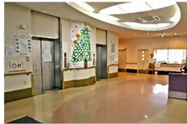
1階エントランスホール