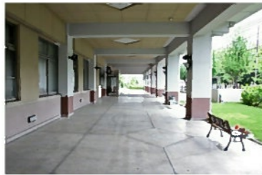
玄関前のオープンテラス