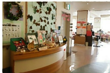
リハビリホールフロア