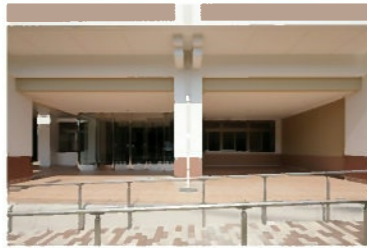
新館オープンテラス